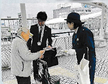
青木信用金庫キャンペーン