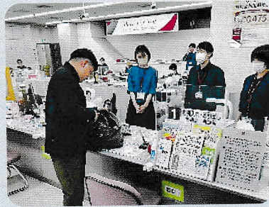
武蔵野銀行川口支店強盗訓練