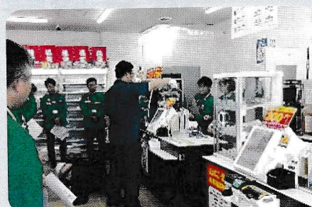
セブンイレブン安行北谷店強盗訓練