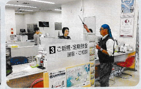
武蔵野銀行東川口支店強盗訓練