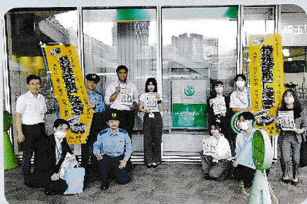
埼玉りそな銀行川口支店キャンペーン