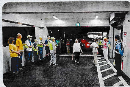
鳩ヶ谷地区夜間合同パトロール