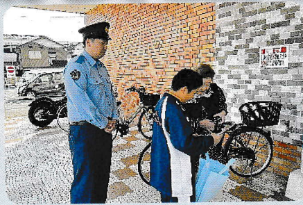
職場体験中学生とマルエツキャンペーン