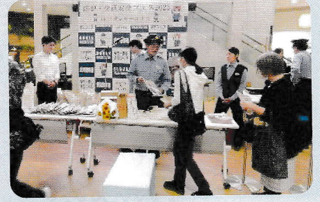
イオンモール川口キャンペーン