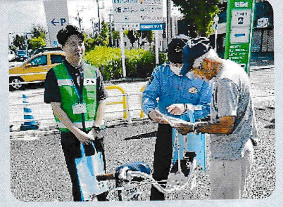
イオンモール前川キャンペーン