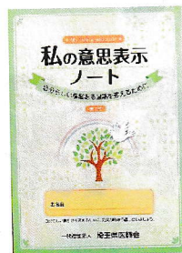
▲埼玉県医師会発行 「私の意思表示ノート」